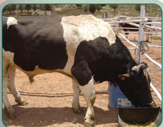
Akaxa jayata uñtkaya jach'a lik'i urqu wakawa