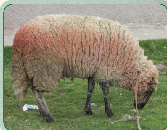
ch'amani lik'i uwijawa