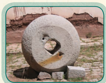
Jach'a qalaxa jathiwa