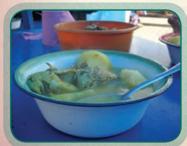
Jayu k'ara wallaqi

Manq'a phayatanakasa jayu k'ara, ch'aphaqa, jaxu manq'anakawa utji, akhama: