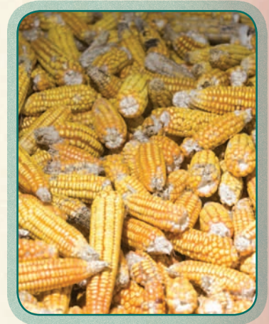
..... muyu qala .....

Akajullinakasuma uñxatasamayjachirinakampisutipa qillqt'apxañani: