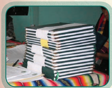
Walja panxa jathiwa

Maya yäna jathitapxa, kunakiti uka kikipawa uñacht'ayi, maya jach'a qalaxa jayata uñtkaya jathiwa, Ukhamaxa mä qawqha jathi yänaka uñjañani: