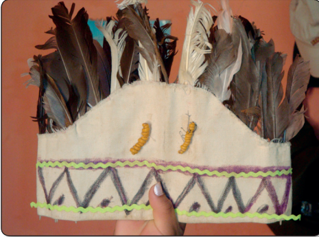
Gorra Leco Barope o Huelpe

El Baba tenía su distintivo, llevaba en la cabeza el wellpe, una especie de corona con plumaje, en su cuerpo el t'alle, su arco y su flecha.