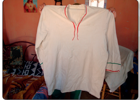
Vestimenta Leco- Talle

Los Lecos de tiempo atrás, tenían vestimentas diferentes. Los varones o abuelos se vestían con talles y las mujeres con urco (una especie de blusa), utilizaban una especie de vestido de colores, con pedacitos de tela costuraban el vestido para que se vuelva grueso y les sirva de abrigo, el vestido era multicolor, así se vestían las abuelas. Después de los 60 años, ellos respetaban su edad.