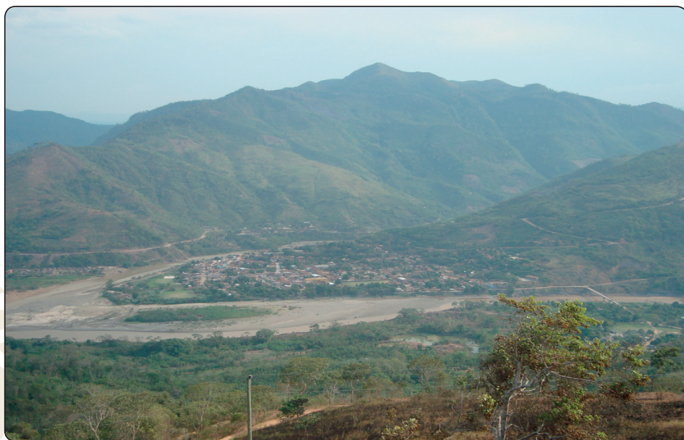
Población de Guanay

Por los años 1980, empezó la organización en diferentes regiones, aprovechando esta situación nos organizamos para acercarnos más a la confederación CIDOB de Tierra Bajas, en el año 1984 nuestra confederación establece su constitución.