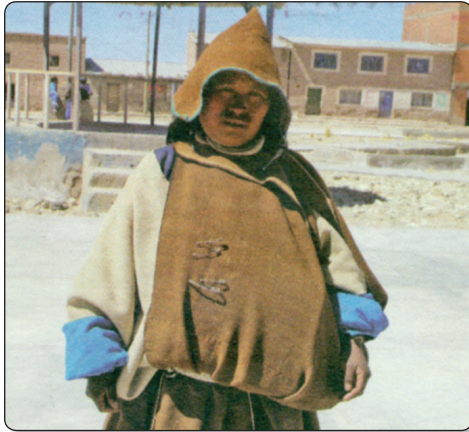
Revista 7 días, 18 de diciembre de 2011, Periódico "Cambio"

Nuestra comunidad Uru Chipaya desde que se asentaron en el lago Coipasa, se organizaron en dos bandos denominados Ayllus, mismas que en nuestra lengua se denominan Tajata (lado oeste, personas que viven en el lado oeste) y Tuanta (los que viven en el lado Este) (aransaya y manansaya), se denomina así porque por medio de la población atraviesa un río donde a su vez se construyó la iglesia. Posteriormente se denominó aransaya y urinsaya, ambas tienen una autoridad máxima a quién se le denomina alcalde cobrador (el que cobraba impuestos).