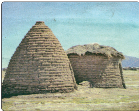
Revista 7 días, 18 de diciembre de 2011, Periódico "Cambio"

Es prohibido mentir, robar, flojear, hasta la actualidad estos valores se cumplen, actualmente podemos afirmar que no existe ni un Uru Chipaya pidiendo limosna. No desperdiciamos el alimento. Tampoco desperdiciamos al agua, pues sabemos darle siempre una buena utilidad. También damos utilidad a todos los fenómenos físicos, el viento, la lluvia, el frío, el calor, la tierra, las heladas.