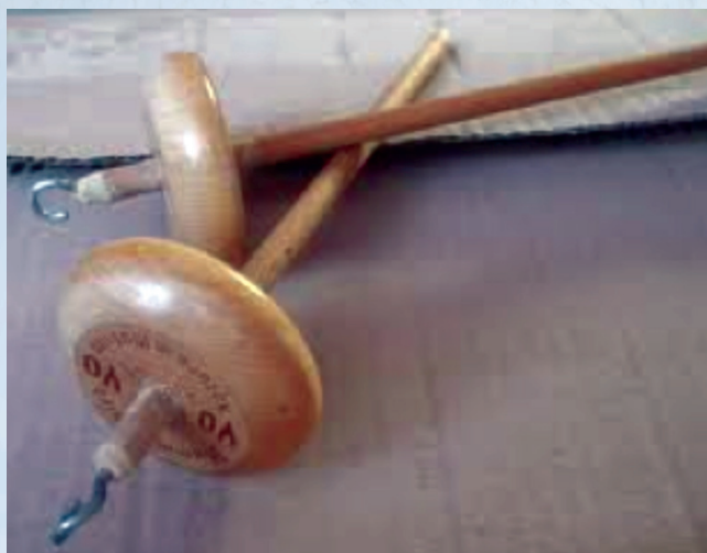
chesi oiporu ëi

Añave yaecha puaë (ë) jare yaeka irü ñee reta yaikuatia vaerä