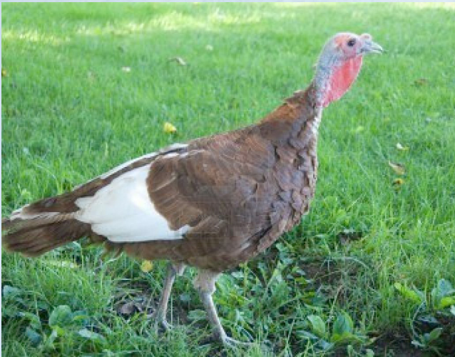
aräkua oï ñanape

Yaecha keräita yaikutia jare yaekata mbaembae jee reta oë kuae puaë (ä)ndive.