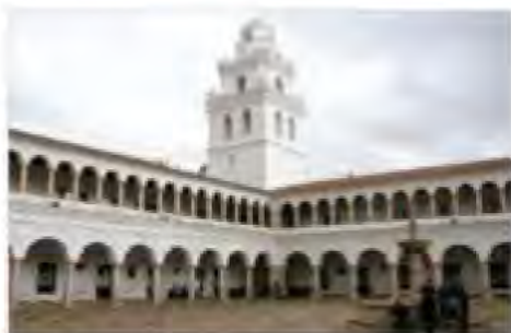
Patio carrera de derecho San Francisco de Chuquisaca

La autonomía le da a la universidad pública la potestad para la libre administración de sus recursos, nombramiento de autoridades, personal docente y administrativo, la elaboración y aprobación de estatutos, planes de estudio y presupuestos anuales; y la aceptación de legados y donaciones, así como la celebración de contratos, para realizar sus fines y sostener y