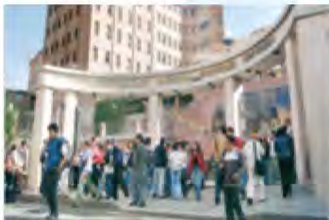
Atrio de la primera universidad privada de Bolivia U.C.B