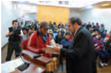
Entrega de Becas